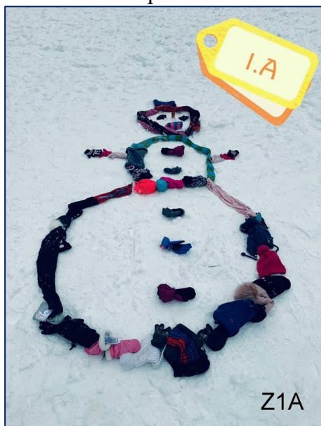
Sněhuláci 1. stupeň ZŠ